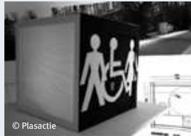
Het toiLED dat de wedstrijd voor uniseks sanitair won. Leuk detail: wanneer het toilet bezet is, kleurt de kubus rood.