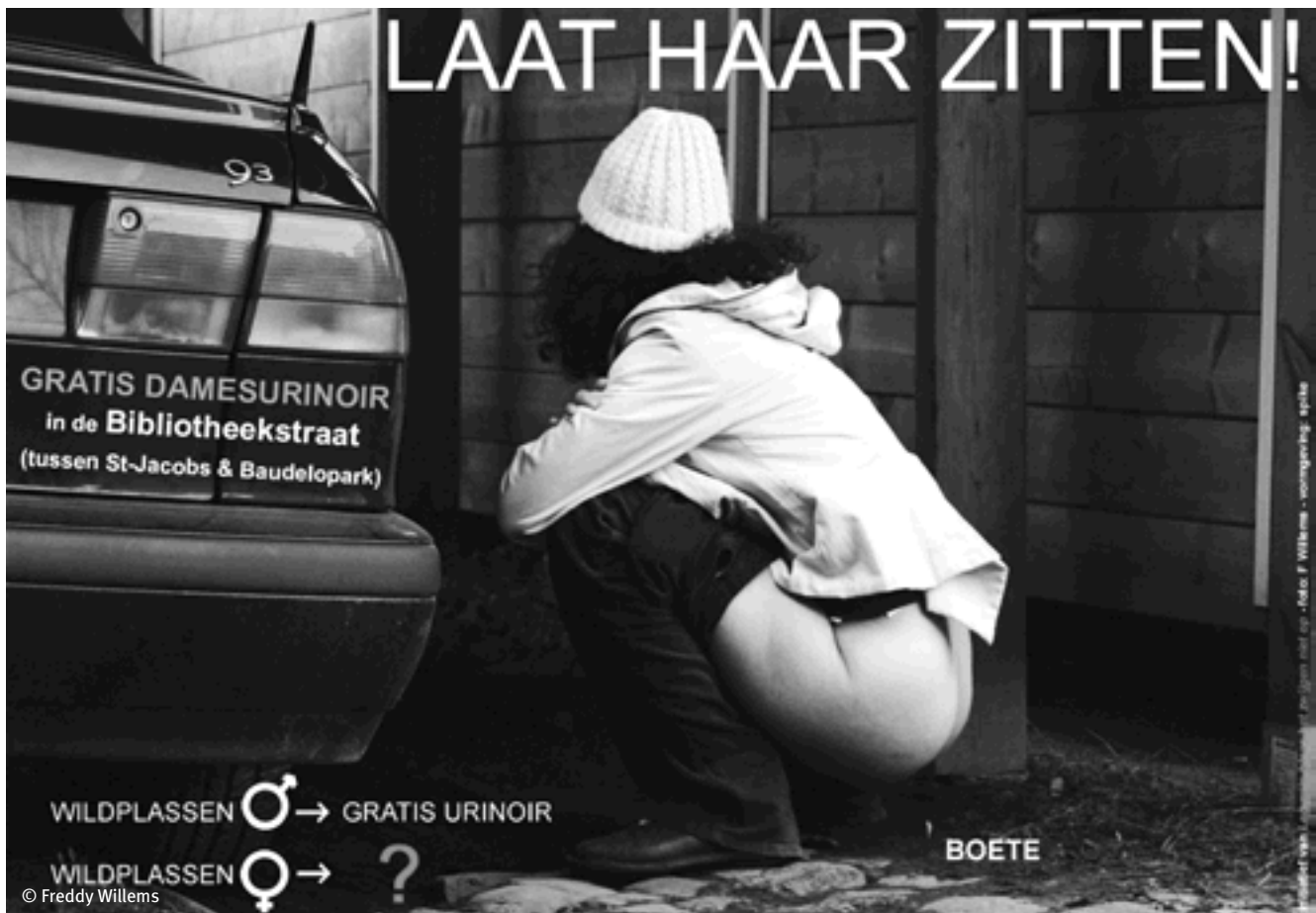
De affiche van de Plasactie die de bewustmaking rond gelijke plasrechten voor vrouwen kracht bijzet.